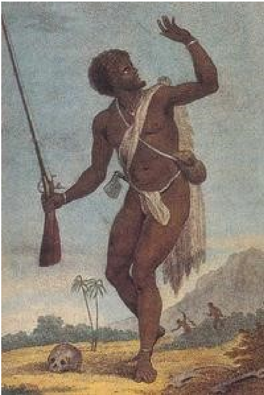
• Een opstandige marron op oorlogspad