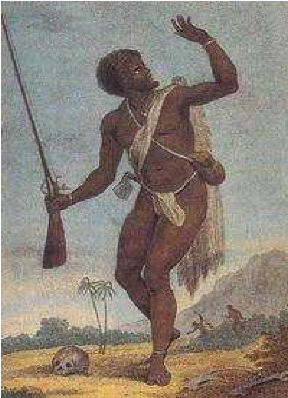
• Een opstandige marron op oorlogspad