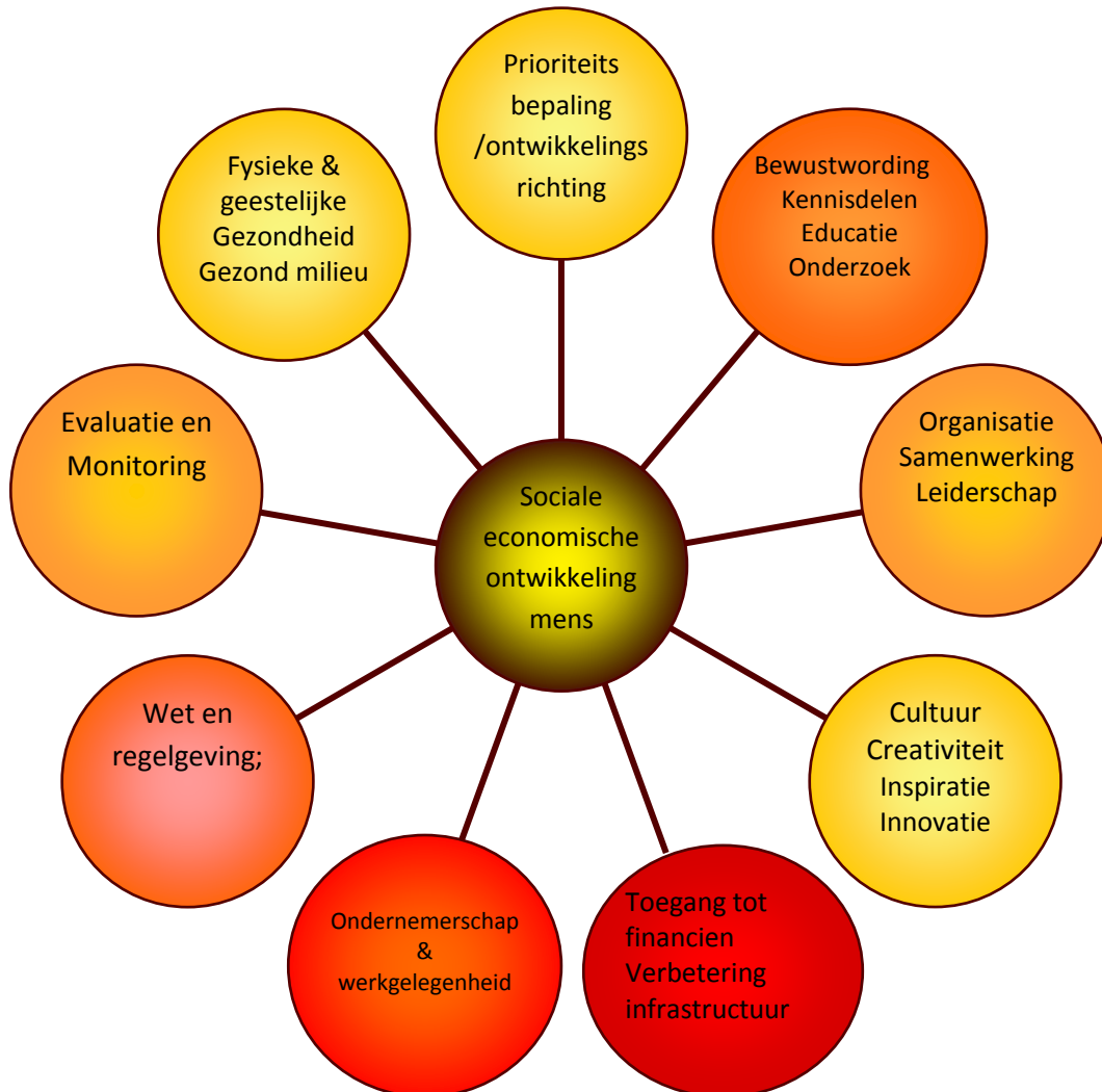
Afbeelding 1: fundamentele sociaal economische ontwikkeling

De geïdentificeerde detail behoeften die zijn geuit door de stakeholders alsmede de grote tekortkomingen van samenleving zijn vertaald naar fundamentele (drivers) voor de sociaal economische ontwikkeling voor het geheel district. In deze “drivers for development” zijn de strategische doelen geïncorporeerd. Zie onderstaande afbeelding # 1. In paragraaf 4.2 worden de operationele doelen en de te ondernemen acties hiervan afgeleid en afgezet tegen een tijdschema