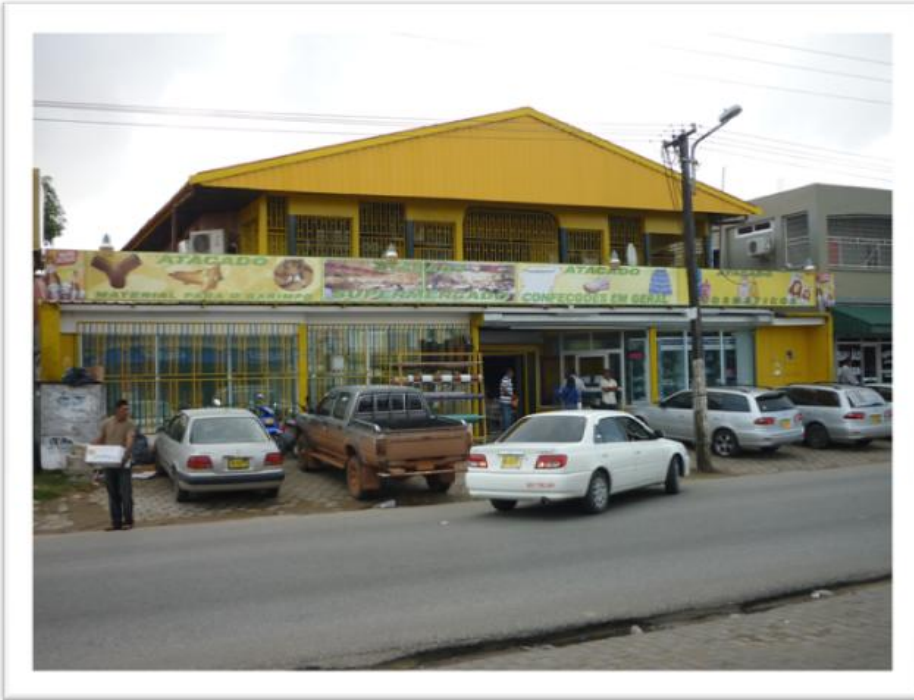
Eigen foto genomen op 09 februari 2010: Anamoestraat in Klein Belém