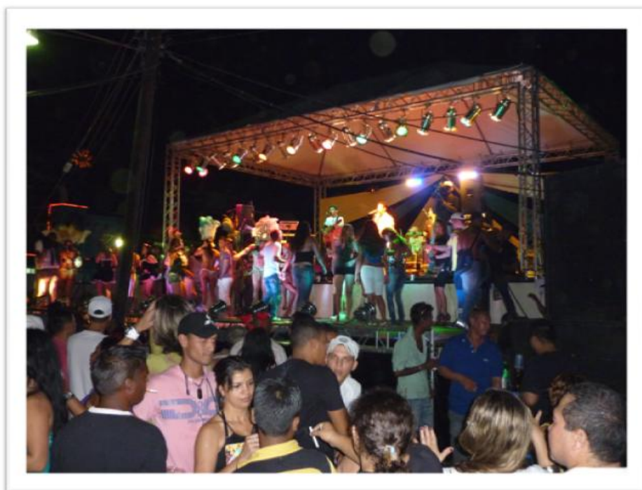
Eigen foto genomen op 14 februari 2010 : Braziliaanse carnavalsviering