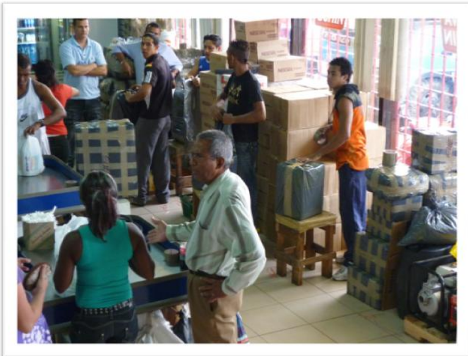
Eigen foto genomen op 09 februari 2010: Boodschappen worden verpakt om naar het bos mee te nemen