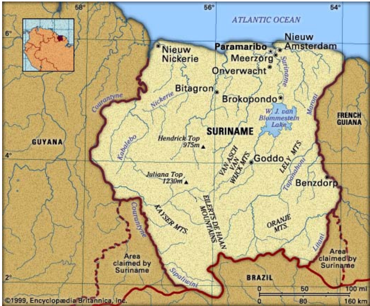
Kaart van Suriname.